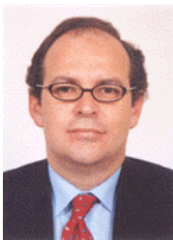
Javier Sánchez Simón

Como es de imaginar la crisis económica ha dejado sentir sus efectos en el tráfico marítimo y en la caída de actividad de nuestros puertos. Con el Presidente de la Autoridad Portuaria de Las Palmas pudimos analizar dicha situación y valorar las medidas introducidas para equilibrar sus cuentas y ajustar el volumen de empleo y necesidades de personal a la realidad del momento y a los requerimientos de mayor productividad y mejor competitividad de nuestros puertos.