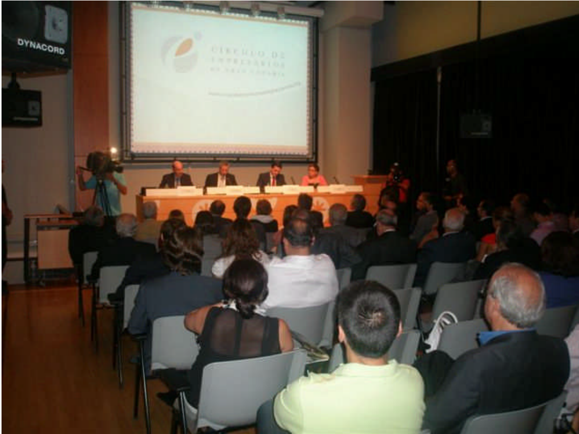
Imagen del acto de presentación en el CICCA de la obra “La Colaboración Público-Privada en la Ley de Contratos del Sector Público: aspectos administrativos y financieros”.