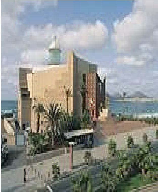
Auditorio Alfredo Kraus